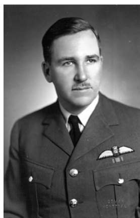
Ronald Weir est enterré à Plot XVI, Row A, Grave 15.