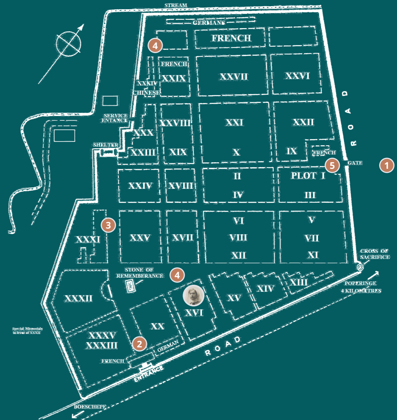
LIJSSENTHOEK MILITARY CEMETERY