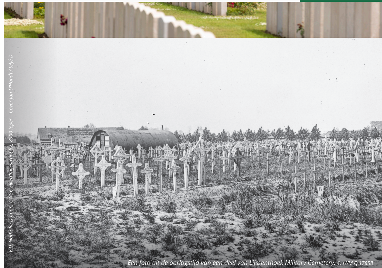
Een foto uit de oorlogstijd van een deel van Lijssenthoek Military Cemetery.

Voor meer informatie kan je deze code scannen.