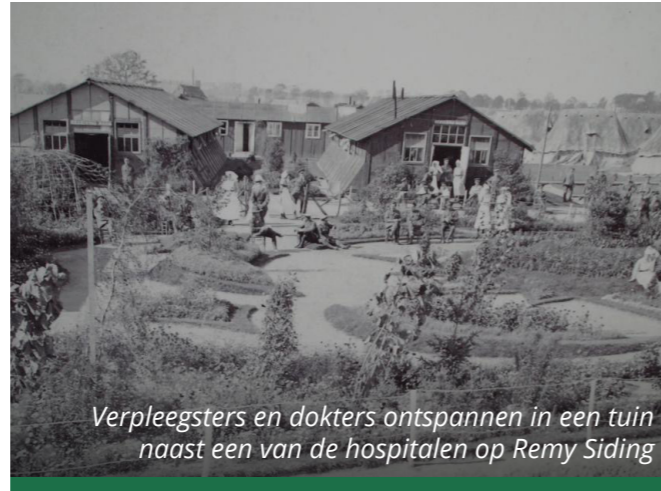
Verpleegsters en dokters ontspannen in een tuin naast een van de hospitalen op Remy Siding